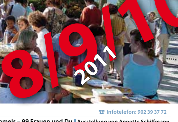
Die längste Kaffeetafel in der Gropiusstadt