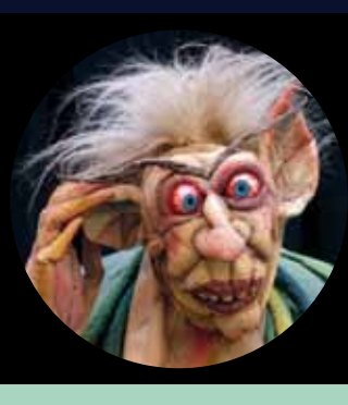
Herausgeber: Bezirksamt Neukölln von Berlin – Kulturamt, Redaktion: Bärbel Ruben, Gestaltung: Marc Regimbogin

Die Sängerinnen haben sich die russische Volksmusik zu ihrer Herzenssache gemacht und tragen mit ihren kraftvollen Stimmen, ihrer Begeisterung und Experimentierfreude zum Verständnis dessen bei, was man „Russische Seele“ nennt.