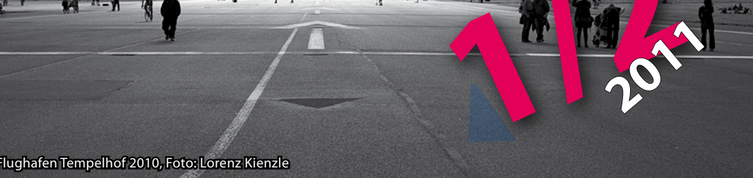
Flughafen Tempelhof 2010, Foto: Lorenz Kienzle