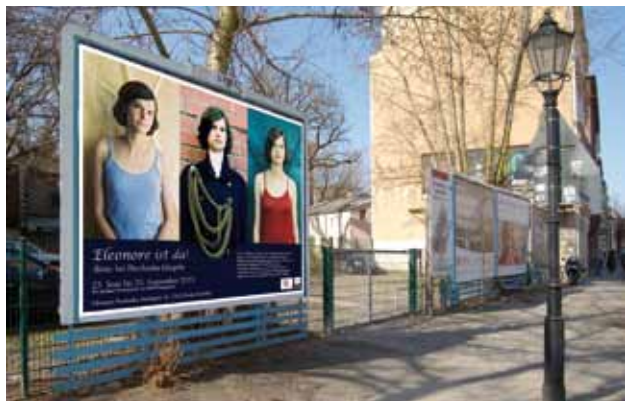
ELEONORE IST DA

Das Festival findet in Nord-Neukölln statt. Es wird alljährlich koordiniert vom Kulturnetzwerk Neukölln e.V. www.48-stunden-neukoelln.de www.kulturnetzwerk.de .