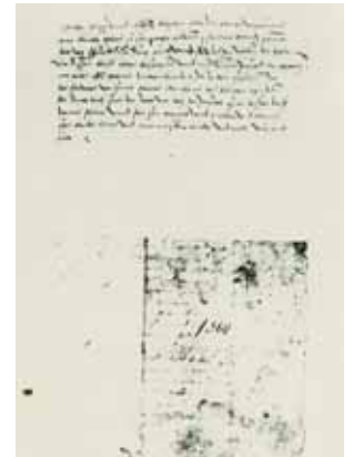
Fotokopie der Abschrift (15. Jahrhundert) der Gründungsurkunde von Richardsdorf 1360, Landesarchiv Berlin.